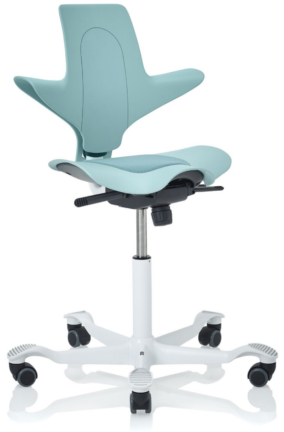
Design: Peter Opsvik. Modèle déposé et breveté